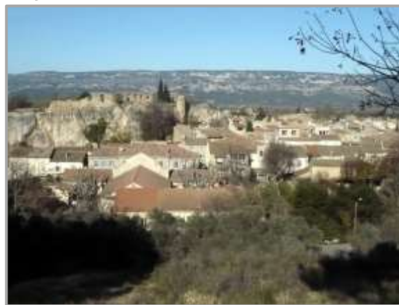
Le village d'Alleins

Alleins , situé au milieu des plaines, entre le pays de Salon de Provence et le Luberon, est un petit village de 2 100 âmes, plein de charme qui permet de découvrir dans un rayon de moins d'une heure de route, la belle Provence des Alpilles, du pays d'Aix et du Luberon.