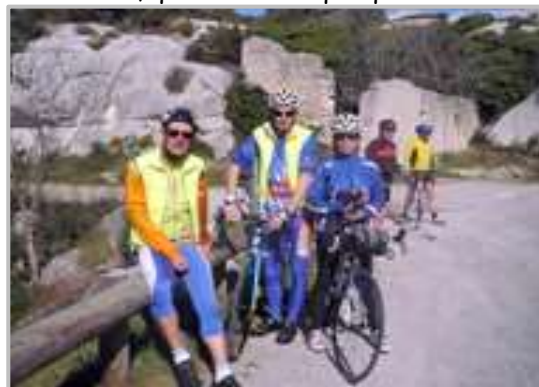
Au sommet du Val d'Enfer

emprunterez l'ancienne voie romaine, direction Arles, qui vous amènera au pied des Baux, par son côté nord en traversant le val d'enfer, par la D27, route beaucoup moins fréquentée par les automobilistes, qui culmine à quelques 223m.