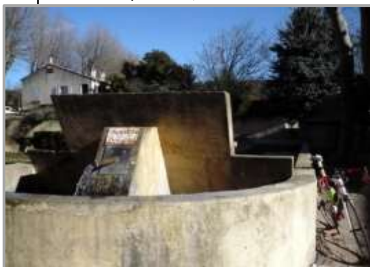
La Fontaine des Bormes

Quelle que soit la saison et la température, été comme hiver, l'eau coule toujours à Eyguières... Vous pourrez donc y admirer de belles fontaines, entre autres la fontaine Coquille, la fontaine Cocotte ou encore la fontaine des Bormes et y faire le plein d'eau fraîche.