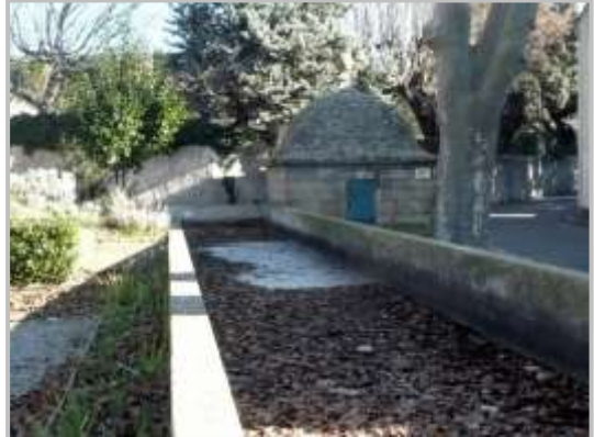
La fontaine des Bormes à Eyguières

Quitter le village par une rapide et courte descente qui vous permet de rejoindre la D17, direction Eyguières en longeant l'extrémité Est des Alpilles.