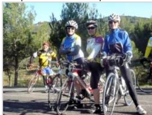
Au sommet de Roquemartine.

Dans la montée de Roquemartine (4 km), prenez votre temps en amenant un braquet raisonnable