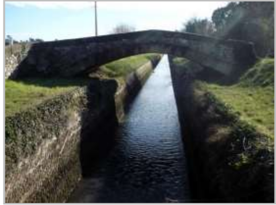
Pont Romain à l'Entrée Ouest de Sénas

Vous venez de découvrir une grande partie du Parc Naturel régional des Alpilles , randonnée Label « A travers les parcs »