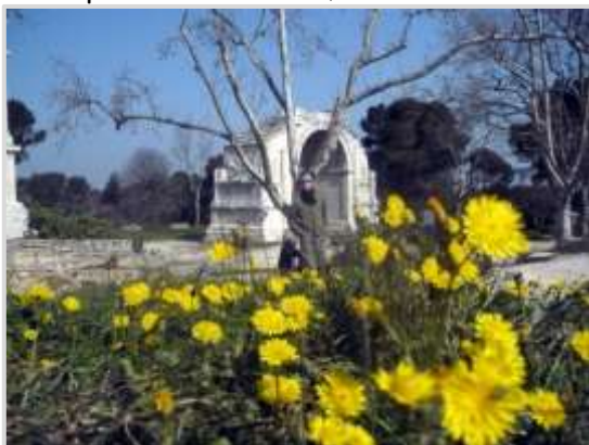
Site de Glanum à St Rémy-de-Provence

Saint-Rémy-de-Provence , 10 000 habitants, situé en plein cœur des Alpilles, fait partie des Plus beaux villages de La Provence. Ses vallons verdoyants et subtilement parfumés, ses belles demeures restaurées avec goût et ses ruelles anciennes pleines de charme, ont fait son succès.