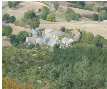
Cabrilac, les bosses de l'Aigoual