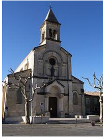
Eglise paroissiale de Générac