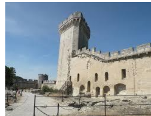
Château-Donjon à Beaucaire