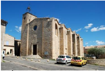
Église Notre-Dame et Saint-André de Congénies