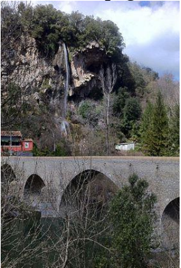
Cascade d'Aigues Folles à Saint-Julien-de-la-Nef.