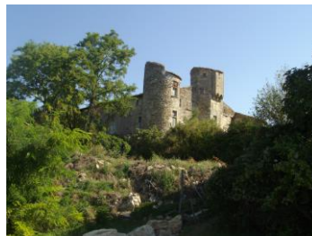
St André d'Olerargues

Méjannes-le-Clap - Istres: 108km et 618m D+