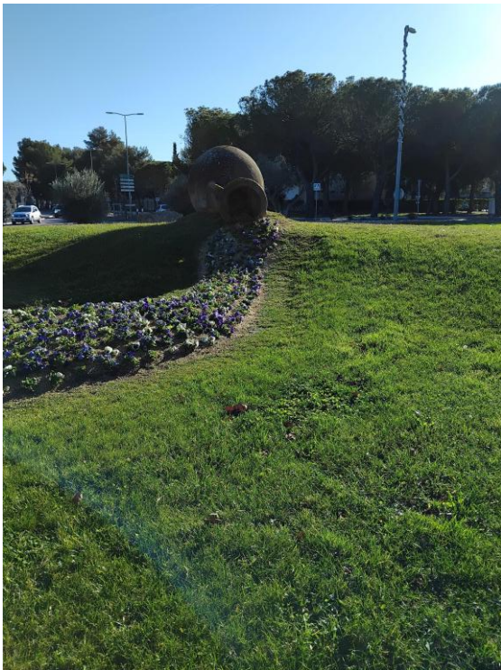
Rond-point de la « Jarre déversant les fleurs »