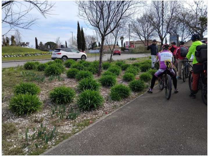
« Les six colonnes » sur le rond-point Louis MAGERE