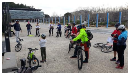
Les « Colonnes de BUREN » devant l'Hôtel de Ville et la stèle de la Paix (ou des Déportés)