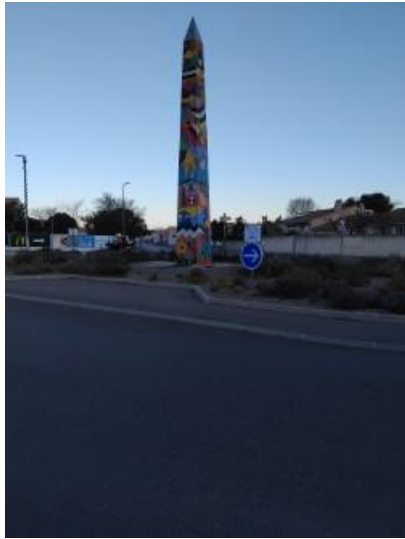
« L'obélisque istréen » au rond-point Jacques CHIRAC