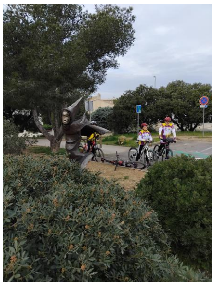
« L'Envolée » près du belvédère sur l'Etang de Berre

Ci-dessous quelques instantanés pris à proximité des œuvres.