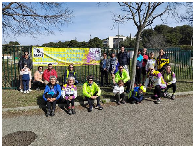
Photo finish de la manifestation devant la banderole