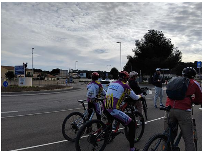
« La statue de l'Unité » rond-point de la paix François SANTOS