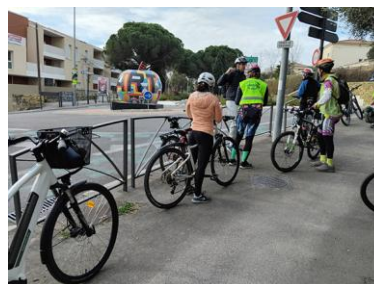
La « Pomme » pop art sur l'avenue Félix GOUIN